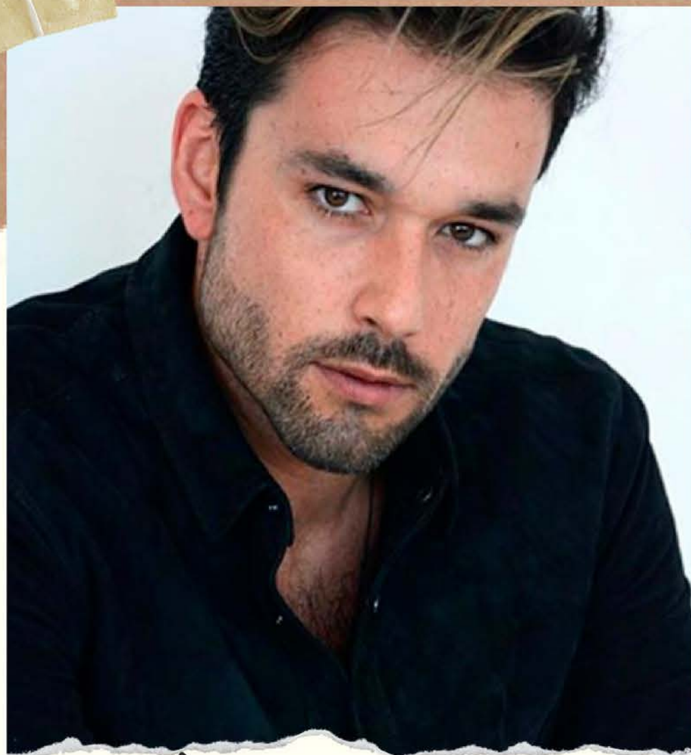
SÉRGIO MARONE em negociação