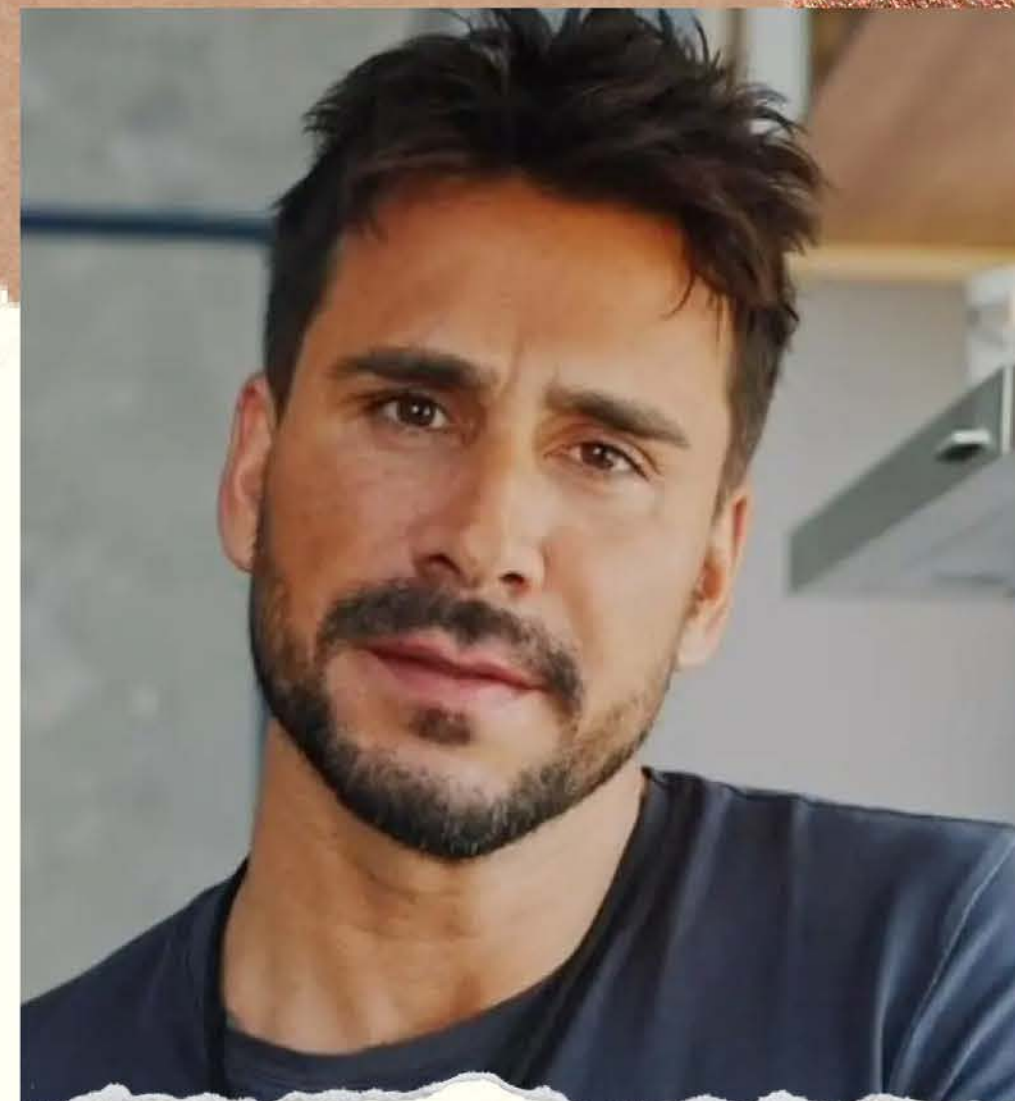
JÚLIO ROCHA ator confirmado