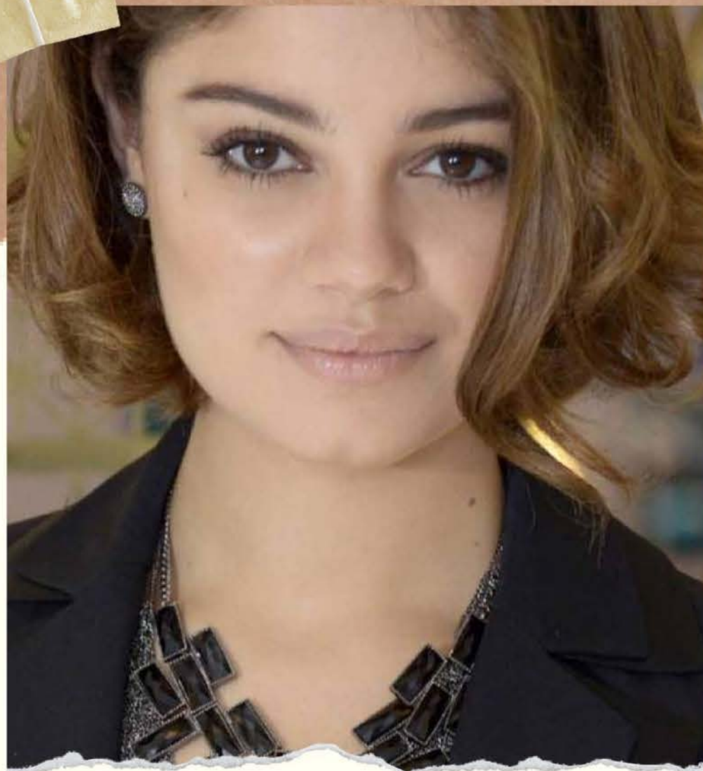
SOPHIE CHARLOTTE em negociação